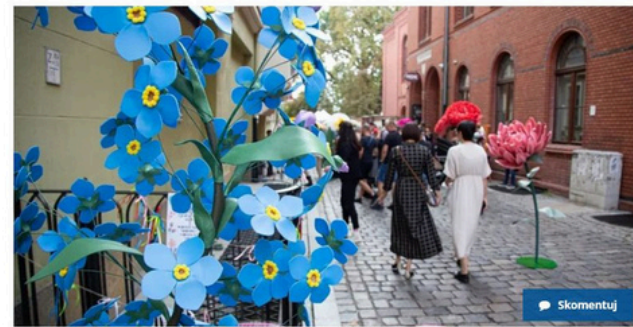
Święto Ulicy Przedzamcze, 23.09.2023 r.