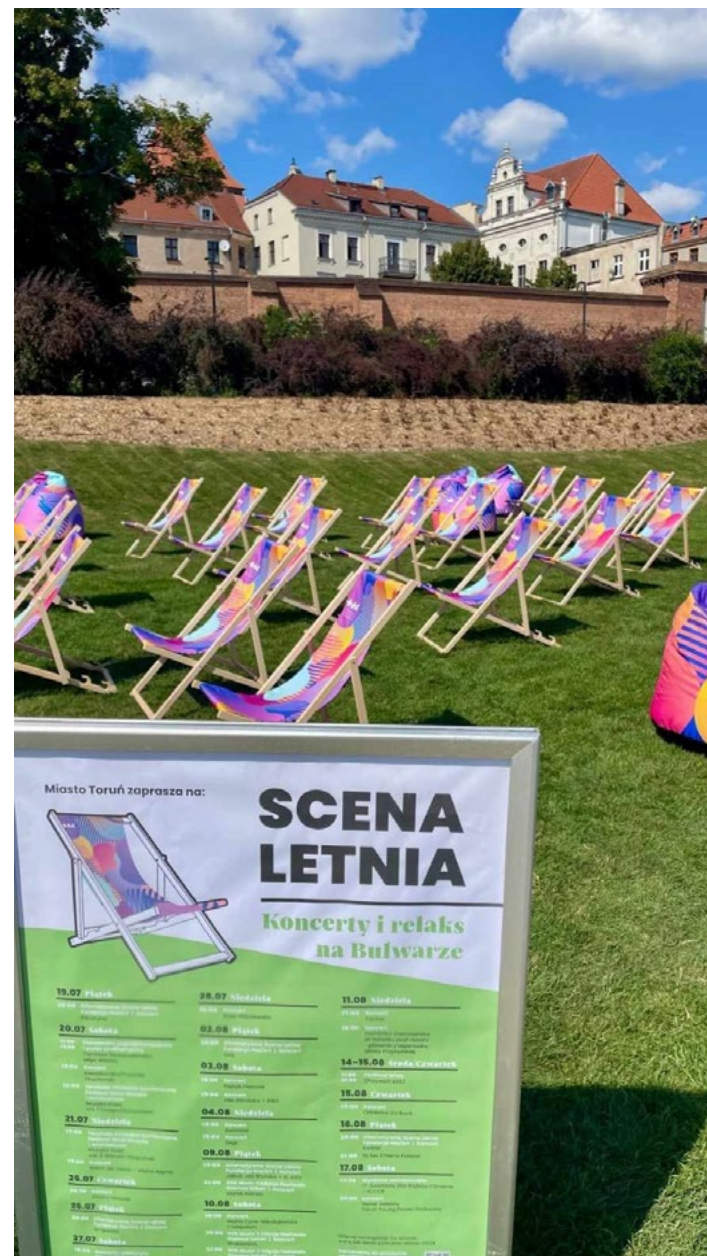
Ekspozycja materiałów promocyjnych i informacyjnych