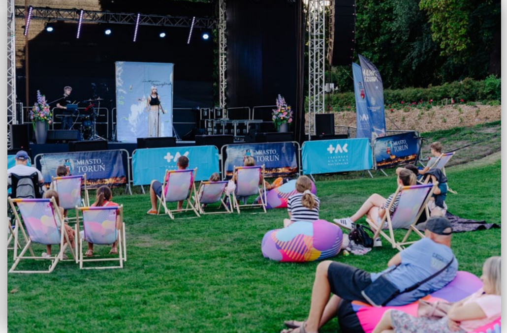
Wybrane zdjęcia z wydarzenia