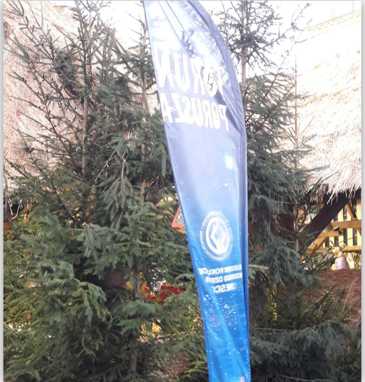
Ekspozycja materiałów informacyjnych