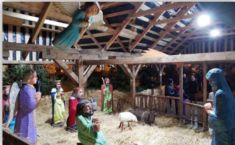
Wybrane zdjęcia z wydarzenia