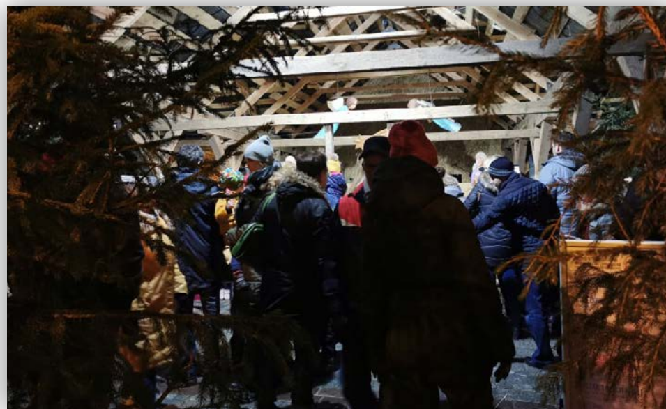
Wybrane zdjęcia z wydarzenia