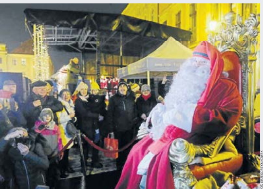
Wigilia Miejska zostanie zorganizowana w Toruniu po raz jedenasty. Wydarzenie odbędzie się jutro na Rynku Nowomiejskim. Początek o godzinie 16

Joanna Maciejewska jama@napijewska.pl joanna@napijewska.pl