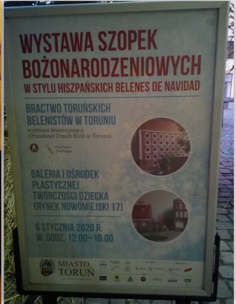
Ekspozycja materiałów informacyjnych