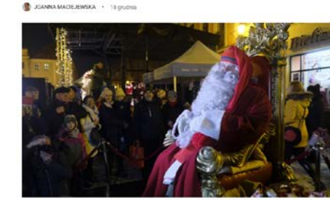
Wigilia Miejska zostanie zorganizowana w Toruniu po raz jedenasty. Tak wygląda w ubiegłym roku organizacja imprezy