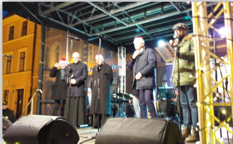
Wybrane zdjęcia z wydarzenia