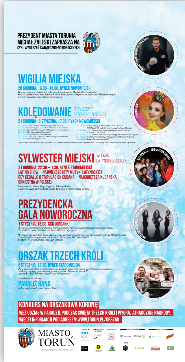
Citylight 1185x1750 mm