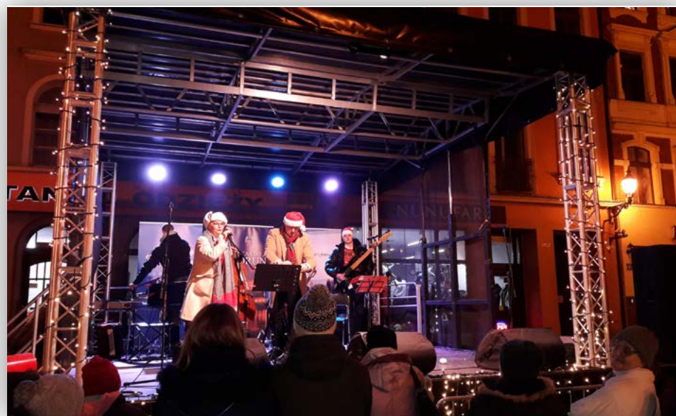
Wybrane zdjęcia z wydarzenia