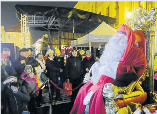
Wigilia Miejska zostanie zorganizowana w Toruniu po raz jedenasty. Wydarzenie odbędzie się jutro na Rynku Nowomiejskim. Początek o godzinie 16

Joanna Maciejewska jama.maciejewska@pik.kapress.pl