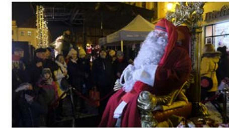
Wigilia Miejska zostanie zorganizowana w Toruniu po raz jedenasty. Tak wygląda w ubiegłym roku Jarmark Bożonarodzeniowy