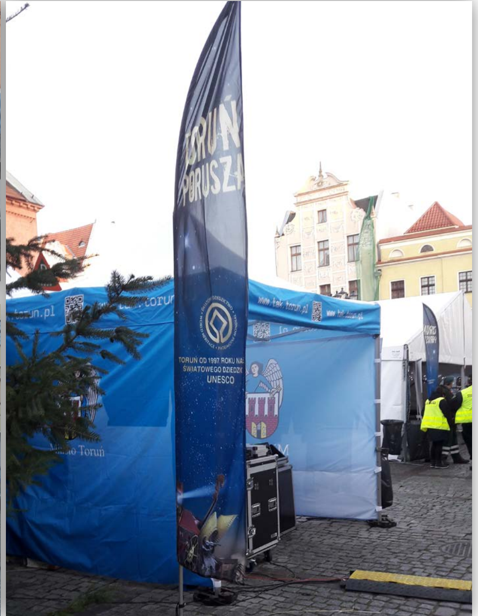
Ekspozycja materiałów informacyjnych