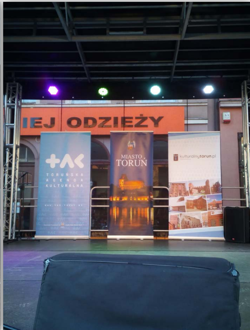
Ekspozycja materiałów informacyjnych