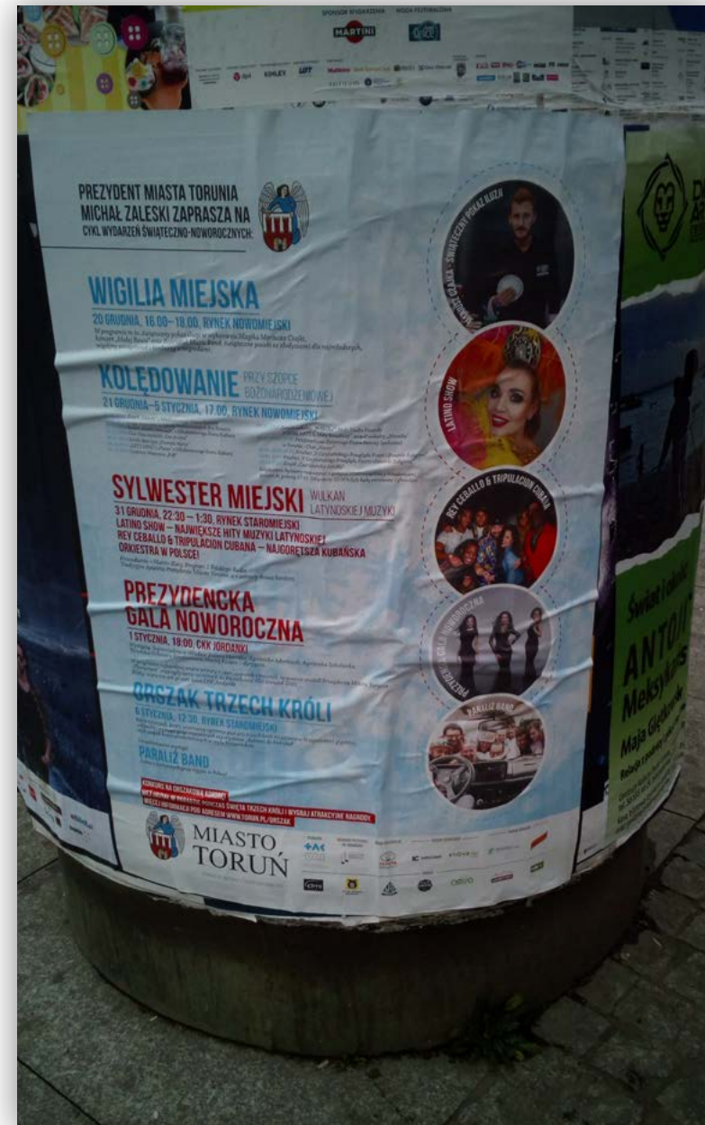
Ekspozycja materiałów promocyjnych