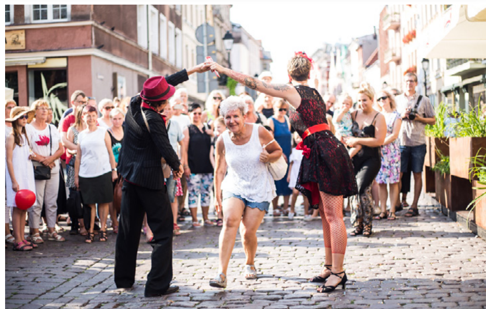
Wybrane zdjęcia z wydarzenia: 28.07., Tango? Si, Tango!