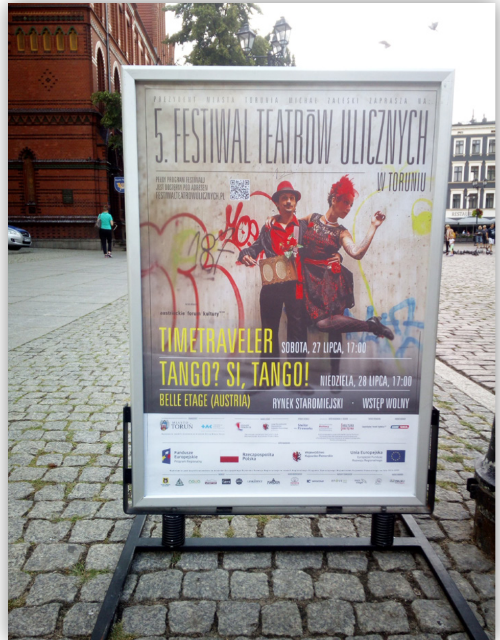
Ekspozycja materiałów promocyjnych i informacyjnych