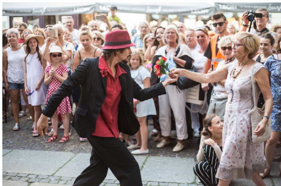
Wybrane zdjęcia z wydarzenia: 28.07., Tango? Si, Tango!