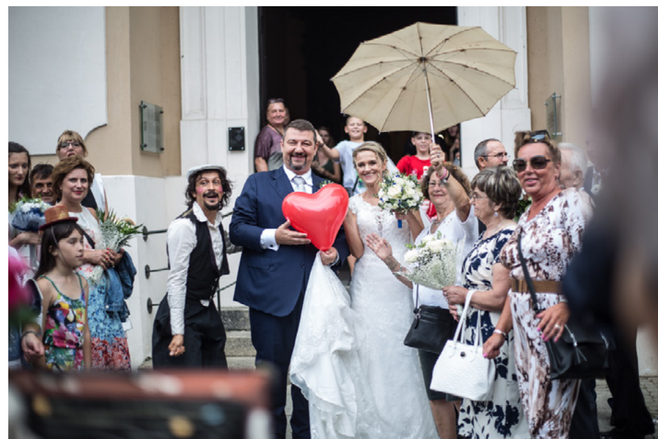
Wybrane zdjęcia z wydarzenia: 27.07., Timetraveller