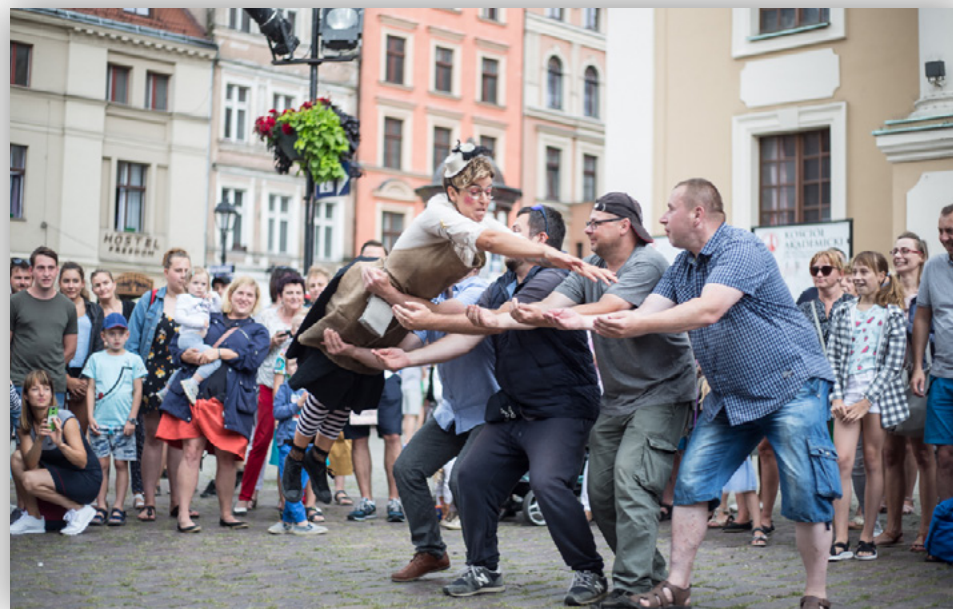
Wybrane zdjęcia z wydarzenia: 27.07., Timetraveller