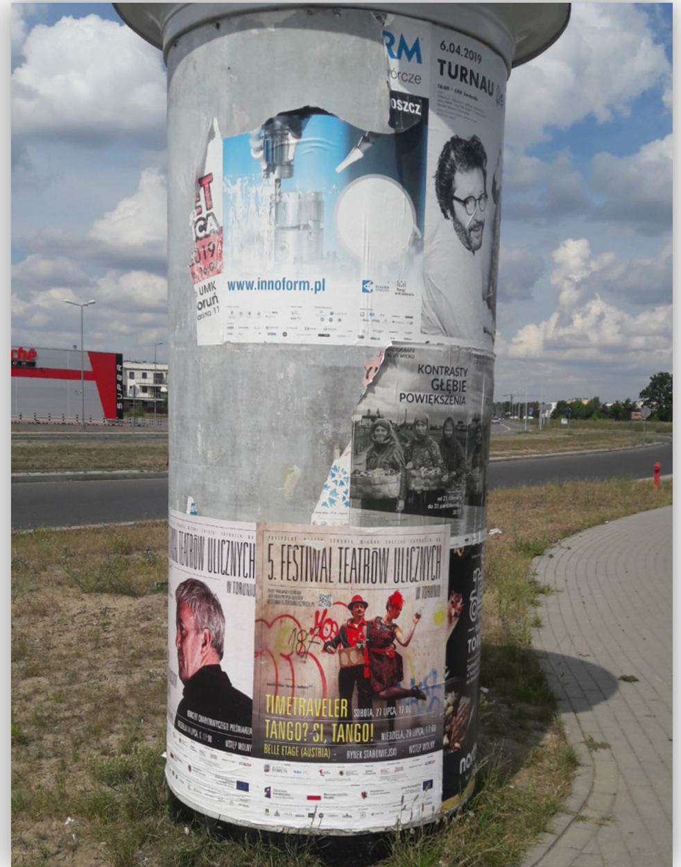
Ekspozycja materiałów promocyjnych i informacyjnych