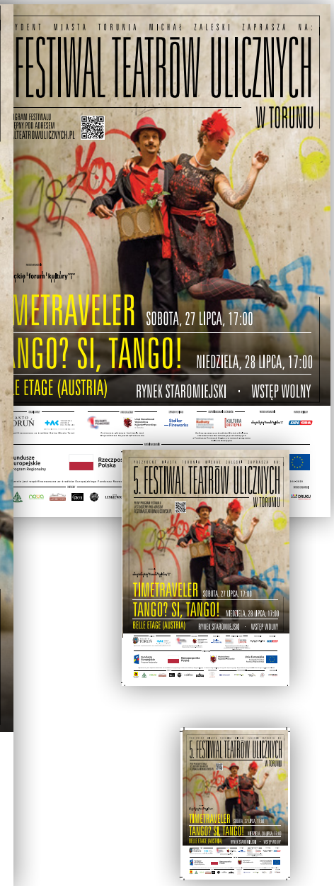
Wybrane materiały promocyjne i informacyjne